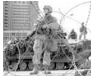
Tanque norteamericano frente al Hotel Palestina