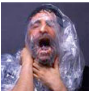
Método de la asfixia