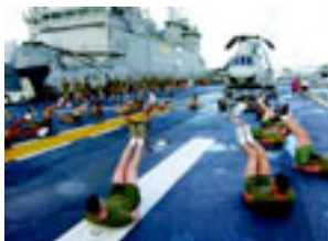
Buque de guerra de EE.UU (cárcel flotante)