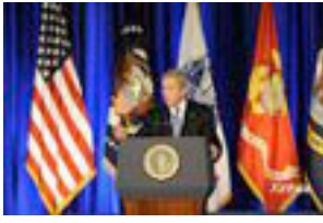
Discurso de la Nación de George W. Bush en 2003