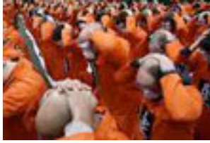
Prisioneros de Guantánamo en formación