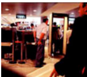
Controles de metales