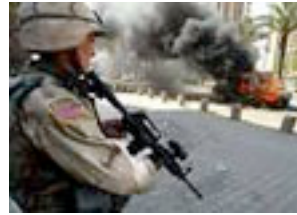
Soldado norteamericano custodiando las calles de Irak