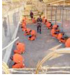
Militares custodiando a reclusos de Guantánamo