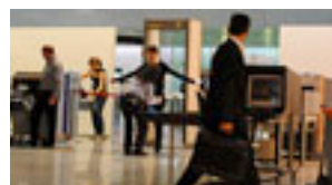
Un pasajero chequeado por policías aduaneros