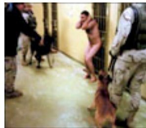
Soldados norteamericanos vejando a un preso en Abu Ghraib