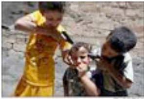
Niños iraquíes jugando con armas