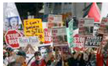
Protestas contra la guerra de Irak, marzo 2003