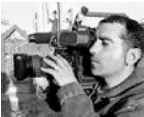
Jose Couso grabando en Irak en abril 2003