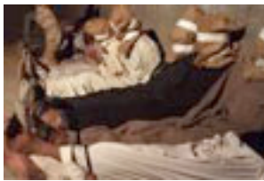
Prisioneros trasladados a Guantánamo